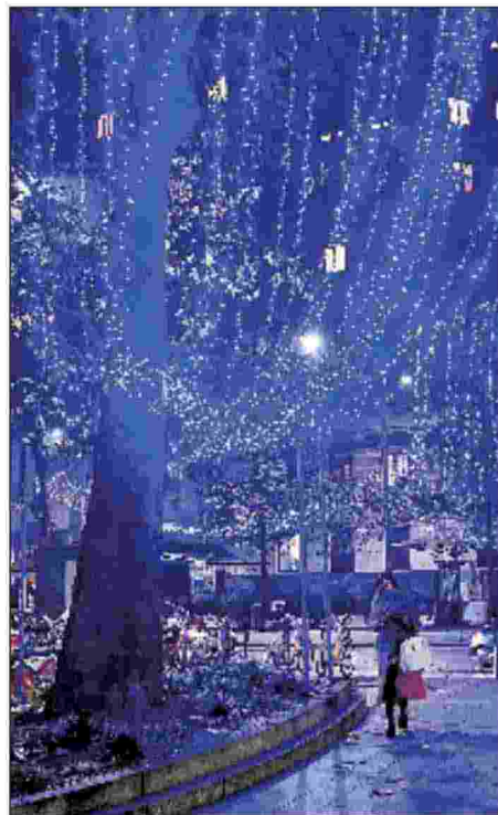
MAGIA DI NATALE Sopra, luminarie all'Arco della Pace. A sinistra, l'albero di piazza Duomo, che si illuminerà a sant' Ambrogio

Risplendono corso Vittorio Emanuele e Sempione Tajani: «Coi privati valorizzati centro e periferie»